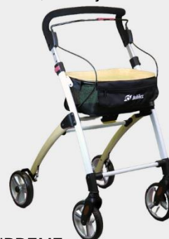
SUPREME Valge/puidukarva 7" hõbedased rattad