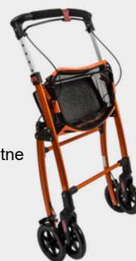
Jaguari standard, kookupandav Sinine, oranž ja violetne