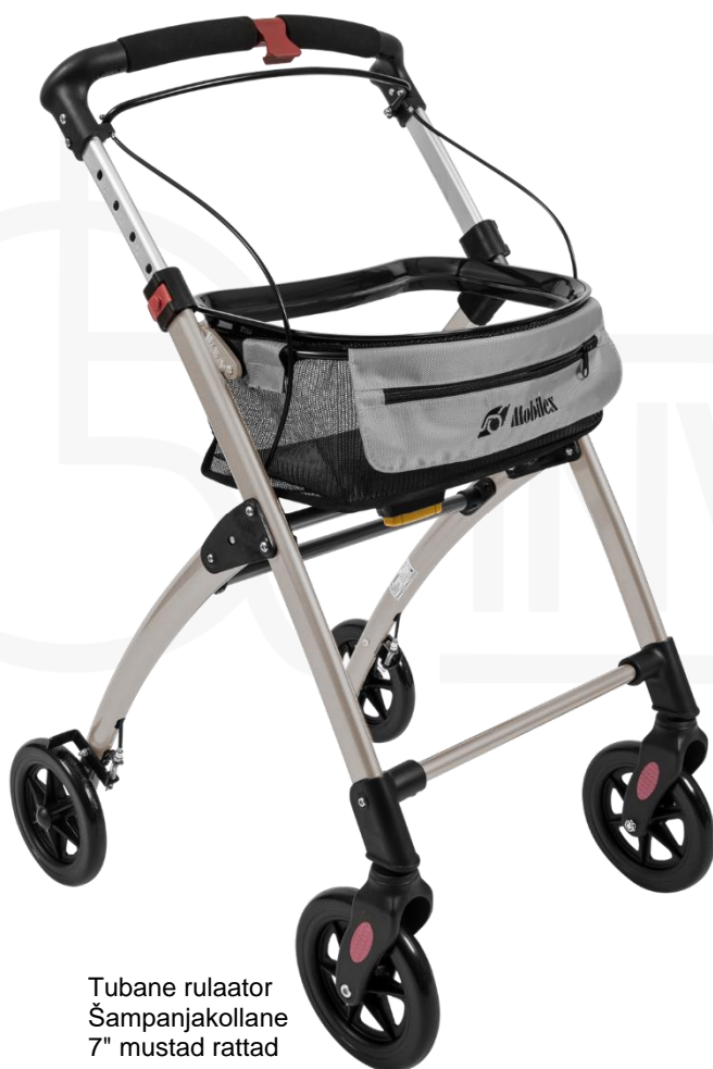
Tubane rulaator Šampanjakollane 7" mustad rattad