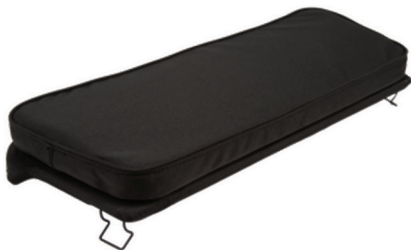
Statsionaarne iste, 312315