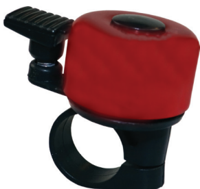
Punane kelluke, 312368