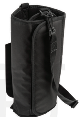
Hapnikuballooni hoidik, 312321