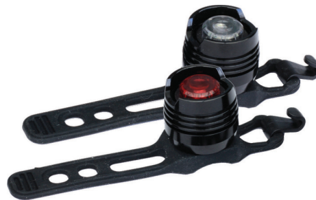
LED-tuled, 31236A + 31236B